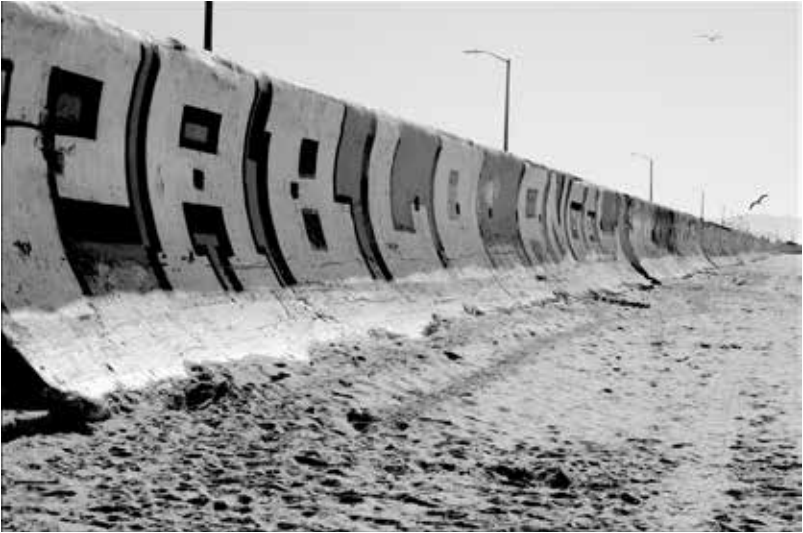
Ocean Beach, San Francisco 2025