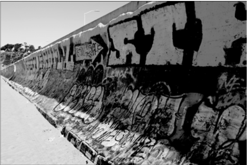
Ocean Beach, San Francisco 2025